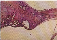
Φωτομικρογραφία ωτοσκληρωτικής βλάβης του αριστερού ωτός. Σημειώνεται ότι η βλάβη εκτείνεται στα μέσου όλου του πάχους της κάψας του κοχλία και προβάλλει ελαφρώς προς τον σπύλο του κοχλία. [Britton BH, Jr, Linnikcum FH, Jr. Otosclerosis: Histologic confirmation of radiologic findings. Ann Otol Rhinol Laryngol . 1970 Feb;79(1):5-11].

Όταν η ωτοσκλήρυνση εξαπλωθεί στον κοχλία, αναπτύσσεται νευραιοσθητήριοις βαρηκοία , που μπορεί να συνοδεύεται από αιθουσαία συμπτώματα και ή εμβοές των αυτιών . Η πλήρης ακοολογική εκτίμηση μπορεί να αποδειχθεί μοναδικά βοηθητική στο να τεθεί η διάγνωση της ωτοσκλήρυνσης αναγνωρίζοντας τη