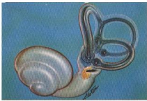
Καλλιτεχνική απόδοση της ωτοσκληρωτικής βλάβης του δεξιού ατιός, όπως καθορίστηκε εξετάζοντας πολλές τομές στη σειρά του κροτοσκόπου οστού. [Britton BH, Jr, Linthicum FH, Jr. Otosclerosis: Histologic confirmation of radiologic findings. Ann Otol Rhinol Laryngol . 1970 Feb;79(1):5-11].

Βρήκαν επίσης ότι οι εμβοές είχαν σχέση και με το γένος ( p < .0001 ), το μέσο προεγχειρητικό επίπεδο γωγής του ήχου δια των οστών ( p = .0012 ), το μέσο προεγχειρητικό επίπεδο αγωγής του ήχου δια του αέρος ( p = .0192 ), και το μέσο κενό μεταξύ της αερίνης και οστικής αγωγής του ήχου ( p = .0075 ). Οι σχέσεις μεταξύ των εμβοών και της ηλικίας του ασθενούς, η διάρκεια της βαρηκοΐας, η παρουσία του σημείου του Schwartz και